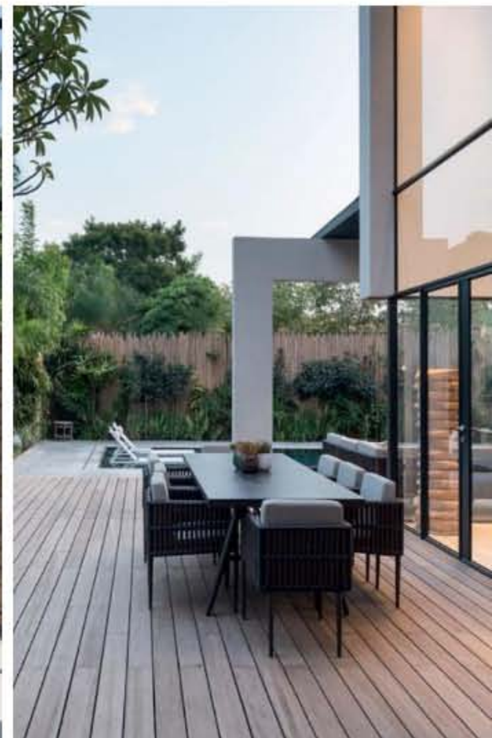
מימין: שעות בין העביים בפנית האירוח החיננית. משמאל: האדריכלים יצרו תחושה של המשך ישר בין הפנים לחוץ תוך נראות של הצמחייה הטרונית.