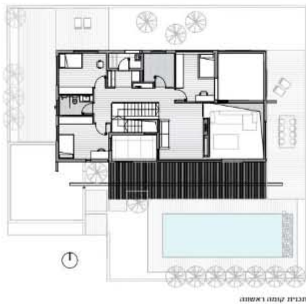
תבנית קומה ראשונה