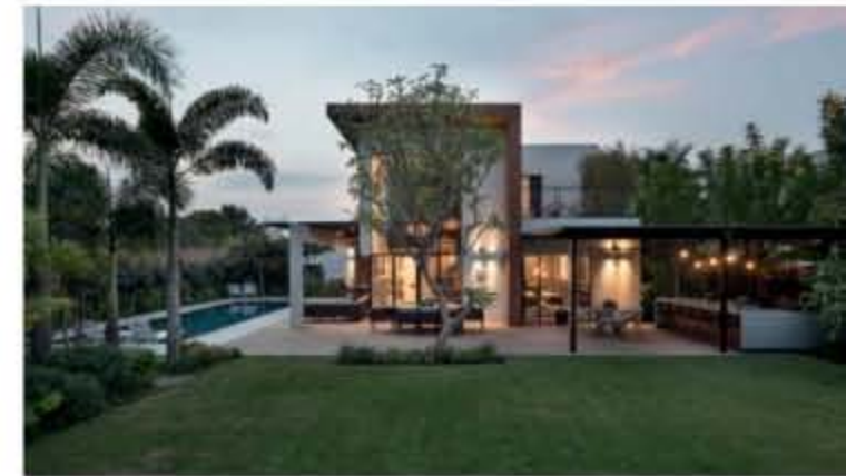
【 מגורים 】

הבית תוכנן לדיירים בעלי אופי מתוח. שביקשו ליצור מרחב מגורים חופשי, זורם, מואר, מאוורר באופן טבעי ופאסיבי, בו חללי הפנים והחוץ הם המשך ישיר אחד של השני ומזינים זה את זה. מרחב מזמין בו ניתן לחגוג, לארח ולבלות באופן רגוע ואינטימי בפורום משפחתי. מרחב שתוכנן תוך התייחסות קפדנית לאקלים המקומי, לתנאי המגרש ולהקשרים הסביבתיים.