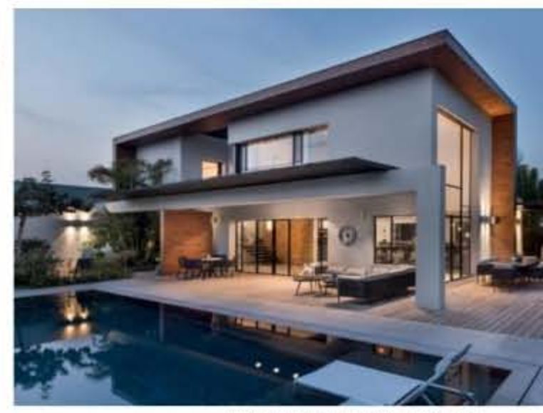
הבריכה מתחננת כך שחלקה היוו כמשטח רטוב לשיזוף.

תכנון נימן חינוך אדריכלים טקסט דבר המתכננים