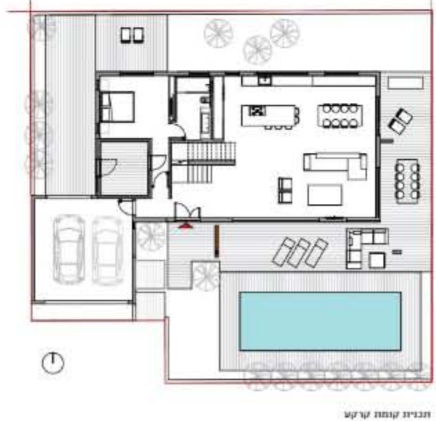
תבנית קומת ירקט

מסגור שטחי חוץ, שימוש בקרירי קל, שולי גג זיזים, קירות חוץ בחומרות משתנה - מטשטשים את גבולות המאסה הבנויה, מעניקים תחושת שחרור ויוצרים מגוון חודרי חוץ איכותיים. אותו טשטוש גבולות מחזק את תחושת המרחב, מרחב הנמשך עד קצה הנוף, כאשר בריכת השחיה משקבת את נוון השמיים נכון לאותו רגע ומשלבת בו מימד דינמי. מבחינה חומרית, הקווים המודרניים, הנקיים, ו"המשבירים" מקבלים "טוויסט", אוריינטלי שמקנה חום וניחוח של חופש, באמצעות שימוש במשורביות פלדה בחיתוך סי. אן. סי, חימוי עץ בנסות משתנה, גופי תאורה מעץ, צמחייה טרופית ומשחקים של אור וצל. בכלל, האור והצל באדריכלות המקומית הם חומר לכל דבר לתפיסת האדריכלים. "החופש", הורטיב המרכזי בתכנון הבית, מקבל ביטוי גם ביכולת להכיל ולתת ביטוי אישי לטעמם של בעלי הבית, לטרנדים משתנים ו"לאהבות קצרות". על מנת לאפשר את הביטוי האישי, המגוון והאקולטקטיות בחללי הפנים עשוי שימוש בשפה האדריכלית כסימור המסגרת, בשילוב הנוכחות העוצמתית והמרכבת של גופי החוץ ■