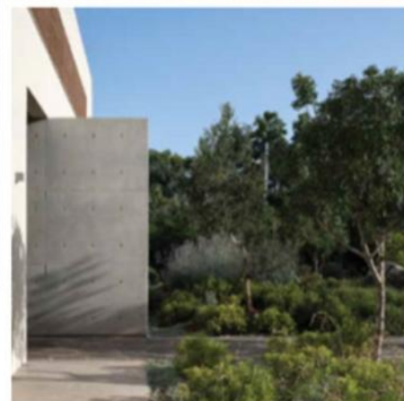
אדריכלות: סימן חינר אדריכלים