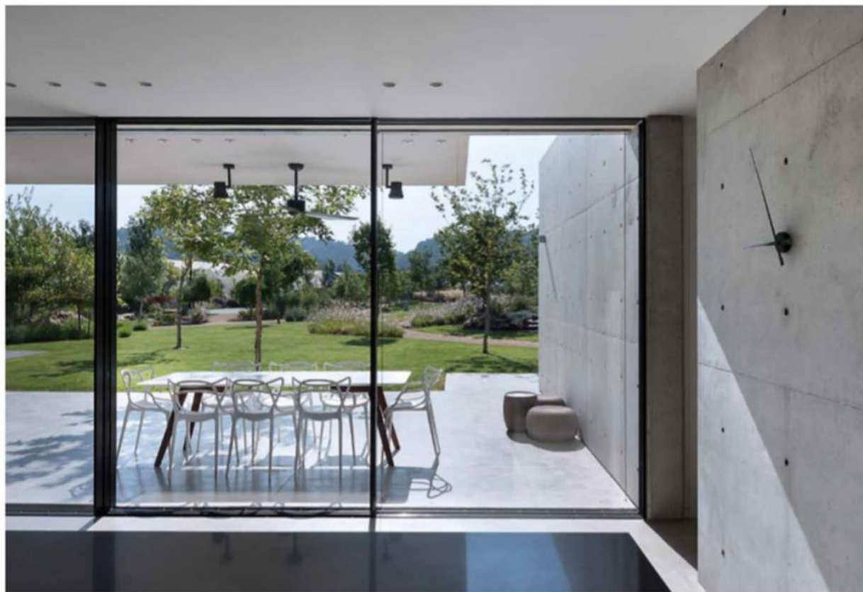
הבתים של היום פתוחים יותר אל הנוף. נודל הפתחים בבתים רבים הוא מקסימלי. החיבור בין הבית והנוף עושה שימוש בחדרים חיצוניים, כמבנים של פרטנולות, כחצרות פנימיות, במעברים ובשכילים החוצים גינה ובית.