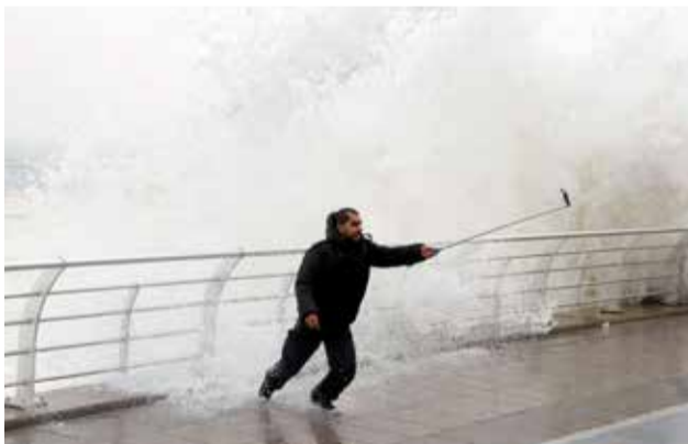
אדם מצלם סלפי בטיילת בירות, בפברואר