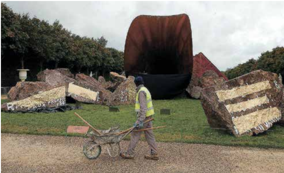
כיסוי הכתובות על הפסל "פינה מלוכלכת", שלושום בגני ורסאי; משמאל: קאפור

התערוכה של קאפור אינה הראשונה שמעוררת מחלוקת בורסאי. ב-2008 התעוררה מחאה לקראת תערוכתו של ג'ף קונס שהוזמן להציג בארמון. בין היתר, טענו גורמים בימין הקיצוני בצרפת כי עבודותיו של קונס "יכתימו את הסמל החשוב ביותר של זהותנו ומורשתנו". מאוחר יותר היו מי שטענו שעבודותיו של האמן היפני טקשי מוראקאמי "משפילות וחסרות כבוד כלפי האתר".