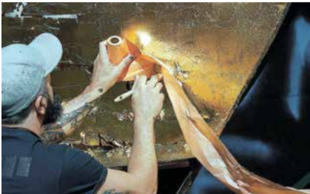
עובד מצפה בזהב חלקים מהיצירה של קאפור

אף שהנהלת האתר הודיעה כי תציב שומרים במקום, כוסה הפסל בכתובות בעלות אופי רויאליסטי ואנטישמי. בין היתר, רוססו עליו המלים "בושה", "חוסר כבוד" ו"בגידה", וכן האמירה: "זהו האונס השני של האומה הצרפתית בידי אקטיביסטים יהודים". קאפור, בן 61, בריטי ממוצא