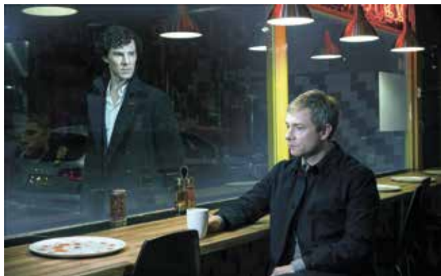
הסדרה "שולוק". לא תשודר בסטרימינג