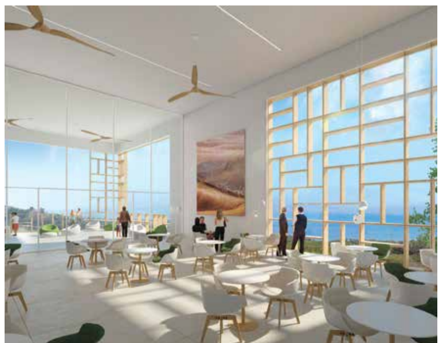
מבט על הפרויקט מבחוץ (למעלה) ומבפנים. יעילות אנרגטית

בעולם קיימים רק כמאתיים מבנים "מאופסי אנרגיה" – המייצרים בדרך סולארית בדיוק את האנרגיה שהם צורכים. הראשון בישראל, מלון ומרכז מבקרים, יקום במושב רמות ליד הכנרת ומתכנניו מסבירים מדוע שאבו השראה דווקא מצורתם של ארגזי פירות