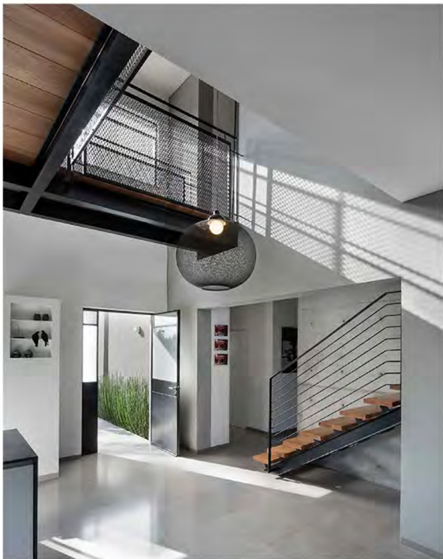
הדלתות הניתנות לפתיחה נועדו למטרות מעבר מן החוץ פנימה ולהפך, החלונות הנפתחים, לרוב הפתחים נמצאים בחלקה העליון של המסגרת, נועדו ליצירת סירקולציה של אוויר

בחדר צר, הוא זה שיוצר נוחות מסימת אל מול הרחוב. מלבדו, החלק היחיד שמשיק אל הרחוב, תפוס על ידי החנייה ומשום כך הכניסה אל הבית מוקפה בצד הבית הבנייה המשתקפת מהחלון הנמצא מול הכניסה. על מימיה הרעננים בנוי חכללה בזהירים, מקבלת את פני הנכנסים. צרה יחסית וארוכה היא נמשכת לכל אורך הבית, וניתן להביט עליה מכל אחד מחדרי הבית.