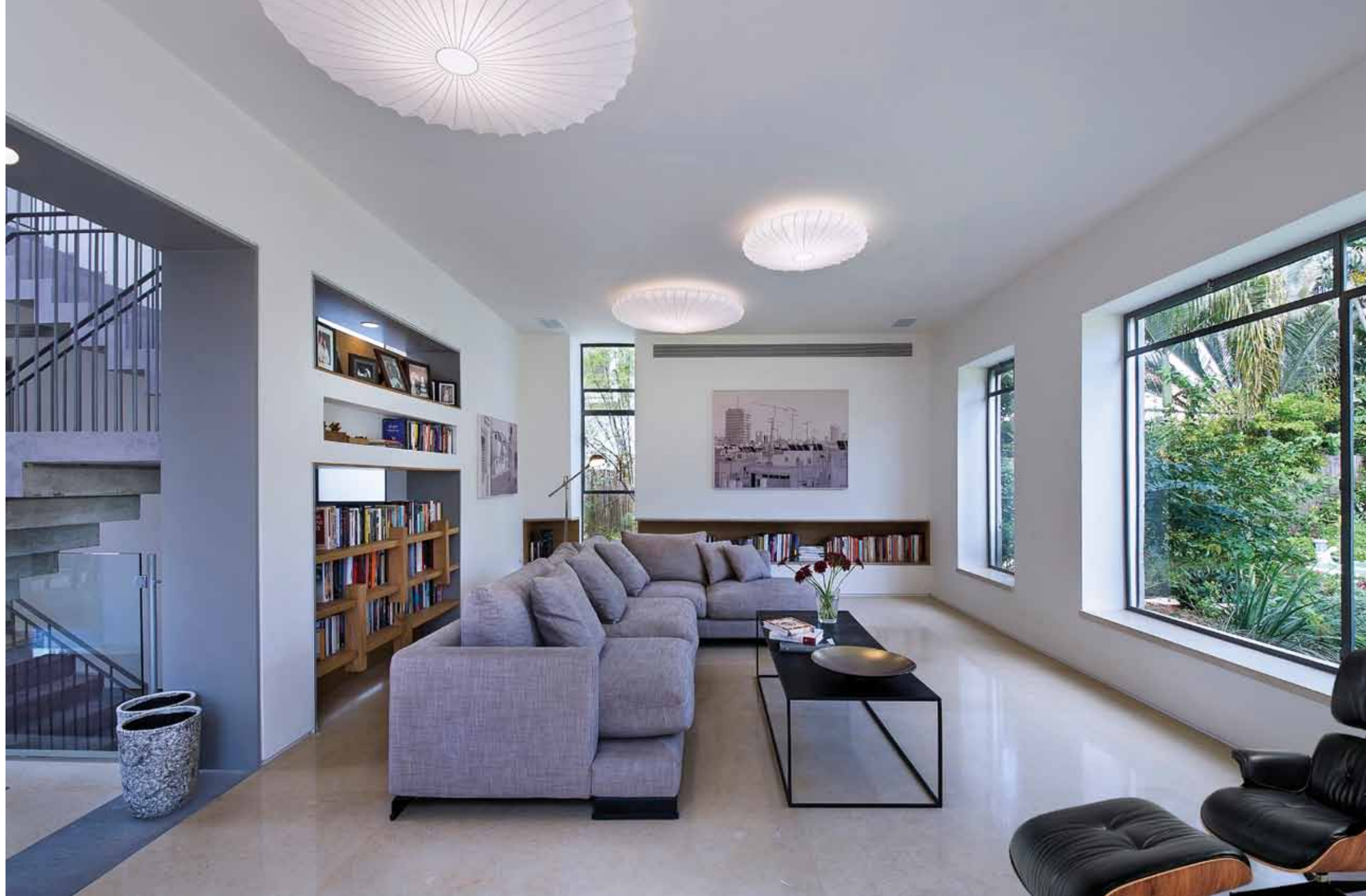
● חלל המדרגות המצוי מעברו השני של קיר הסלון: ספרי הספרייה המבצבים בינות למדרגות כמו תוחמים אותו.