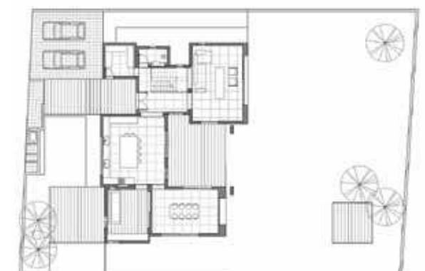
תכנון: אדריכלית שרון נוימן, שרון נוימן אדריכלים צוות תכנון: הילה צור (אדריכלית אחראית), שרון וולמן פיקוח בנייה: גיל אבין | פרויקט: תכנון בית פרטי

הבית שתכננה האדריכלית שרון נוימן באחת מערי השרון נרקם כמקבץ של קוביות. כל חלל בו אמנם מוגדר בנפרד, אך ביחד הם מתאחדים לשלמות אחת- למרחב מגורים מודרני וחמים כאחד