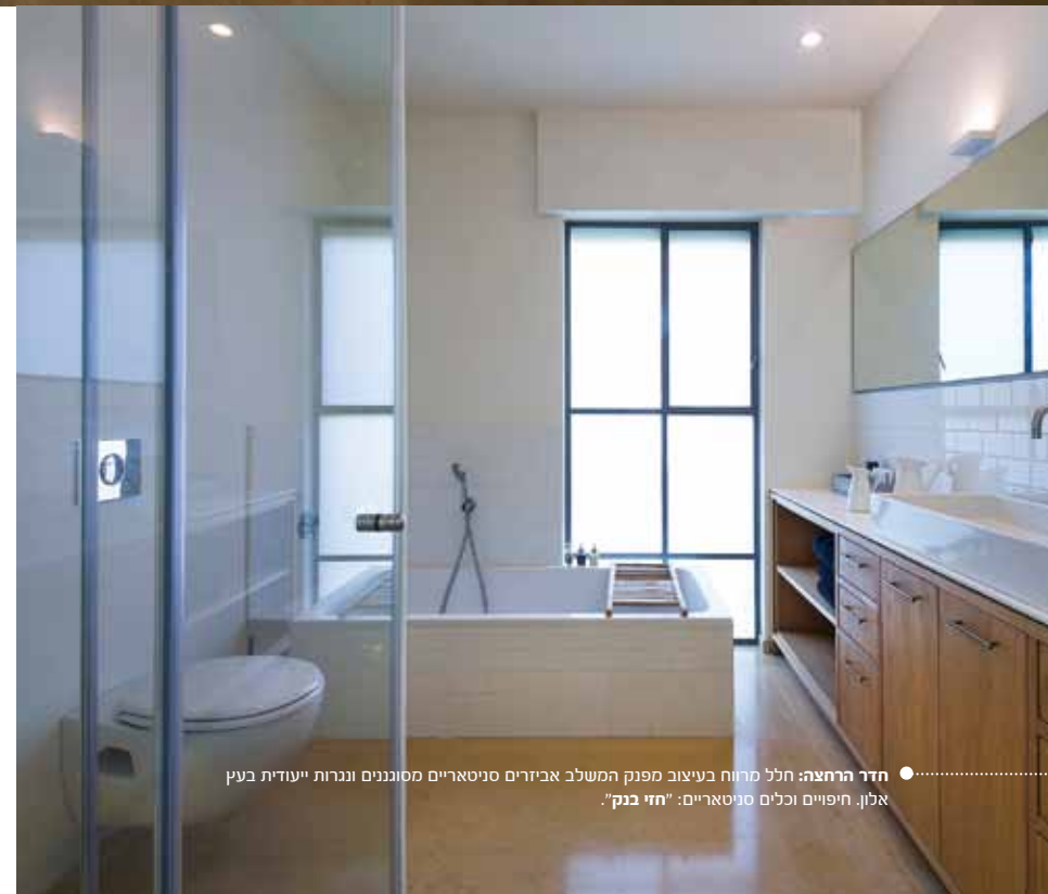
● חדר הרחצה: חלל מרווח בעיצוב מפנק המשלב אביזרים סניטאריים מסוגננים ונגרות ייעודית בעץ אלון. חיפויים וכלים סניטאריים: "חזי בנק".