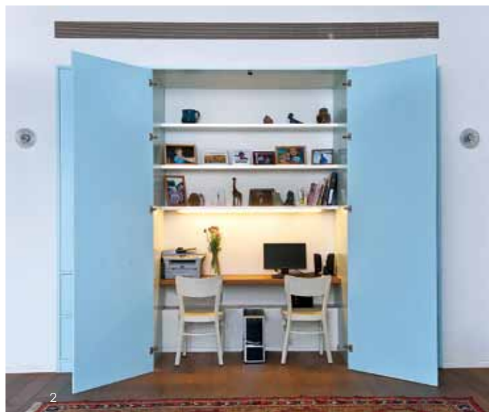
1.5.6.Sharon Neuman讓建築保持簡單的型態，在室內而是利用家具的設計和色彩點出空間主題。2.隱藏在客廳旁的藍色木門內，是Sharon Neuman為屋主設計的小型書房空間。3.不特意塗抹，保留混凝土的淳樸特色，主臥室以開放做主軸，呈現清爽自在的氛圍。4. L型的室內長廊區設計長型天井，除了通風，透白的牆面搭配上端景與陽光，更顯舒適。

1966年出生於以色列，為當地知名的女性建築師、室內設計師與產品設計師。取得Haifa and Cardiff大學中猶太復國主義婦女組織的建築設計研究學士學位、以色列科技大學建築學位、工業設計理學碩士、以及Bar Ilan大學物理碩士學位。畢業後，Sharon已經陸續經手超過兩百棟不同建築規劃，其中一些作品更刊登在國際專業刊物和書籍。無論是建築設計、工業產品、裝飾藝術，均獲得不少獎項的肯定。自2003年開始，Sharon正式接掌Haifa and Cardiff大學中猶太復國主義婦女組織的建築設計教授一職至今。(www.sharon-neuman.co.il)