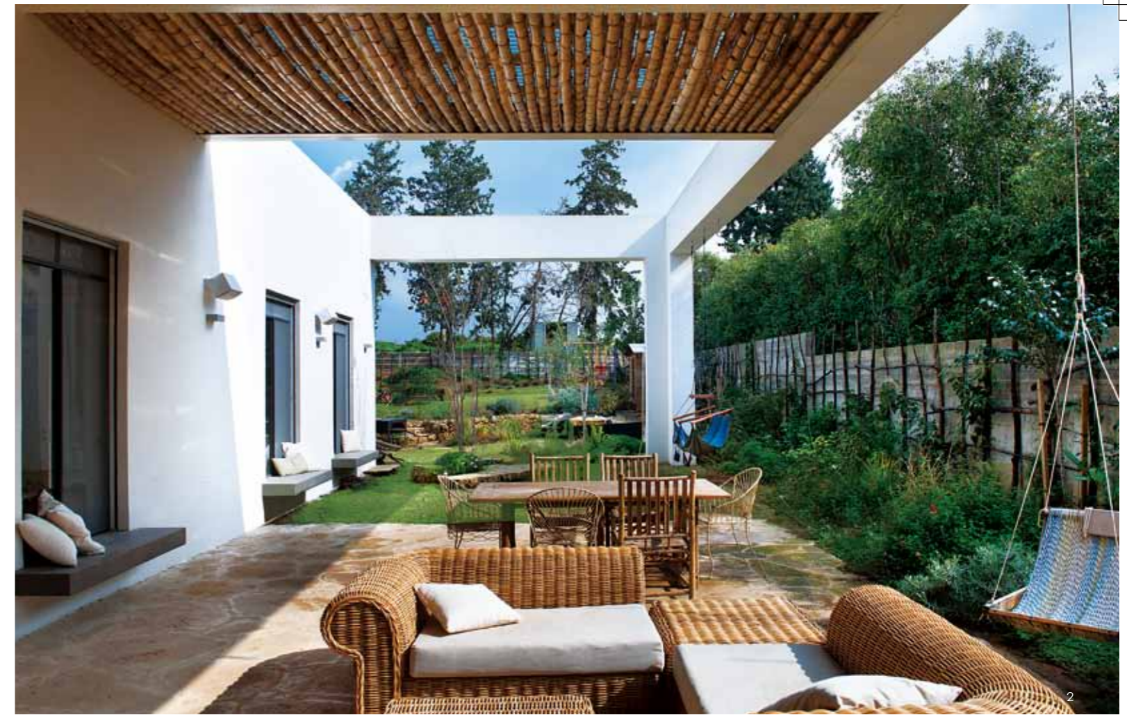
1.白色方型建築在天地的擁抱下格外醒目。2.在被建築包覆的花園中，臥房窗台成為最舒適的倚靠區。3.純白之中點綴點不同色彩，就能演繹別具個性的風格，大門入口處就是最好的例子。

說到以色列，其實在建築學或設計學上少見從此發跡且聞名世界的人物，但話又說回來，這塊由猶太教數千年歷史交織構成的宗教故鄉，具備了全世界各種民族的文化層面，在藝術、創造方面，更是人類史上最重要的一個發跡之地。在此，雖然長年征戰，但因此更獲得不斷改建、發展的契機。