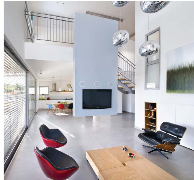
Un muro volado, los escalones flotantes de la escalera y el corredor principal dividen la sala de TV de la cocina.

Desde la entrada principal, al fondo del corredor, a través de los ventanales, se ven los campos de cultivo.