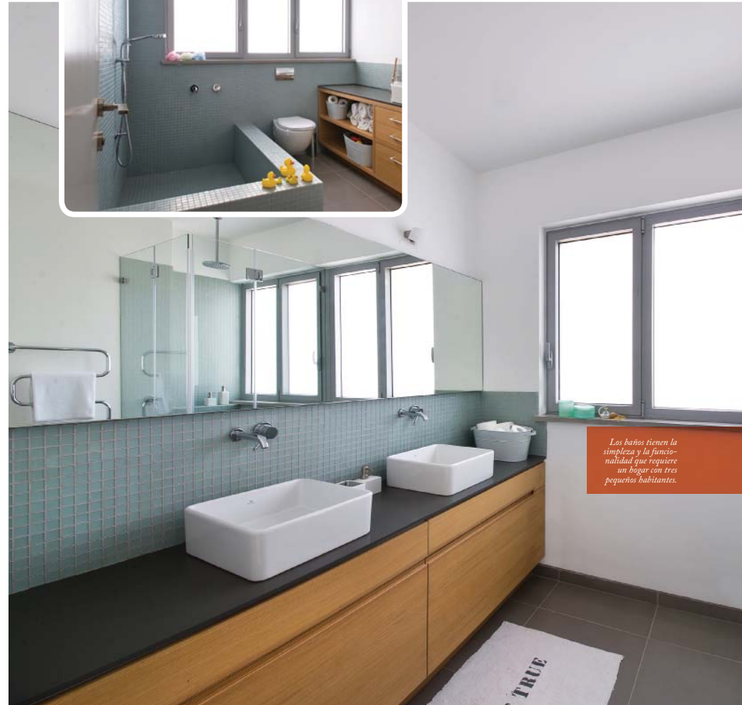
Los baños tienen la simplicidad y la funcionalidad que requiere un hogar con tres pequeños habitantes.