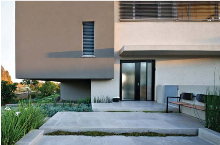
En la fachada principal es evidente la solución estructural de arquitectura contemporánea.